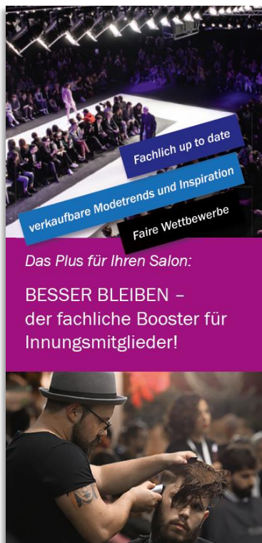
FLYER - Fachliche Vorteile Art.-Nr. 8040 | 79,00 EUR