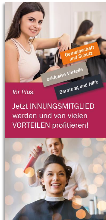
FLYER - Mitgliederwerbung kompakt Art.-Nr. 8035 | 79,00 EUR