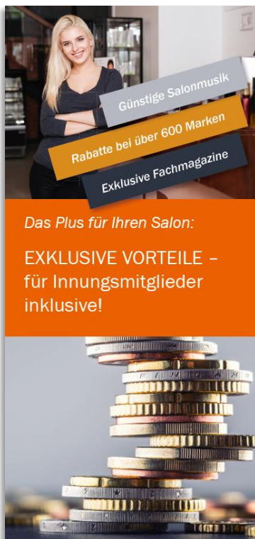
FLYER - Geldwerte Vorteile Art.-Nr. 8041 | 79,00 EUR