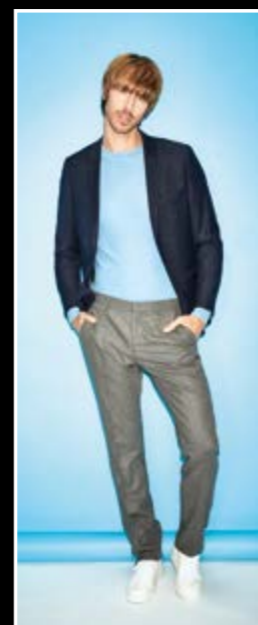
Banner-Motiv 1 Art.-Nr. 13701001