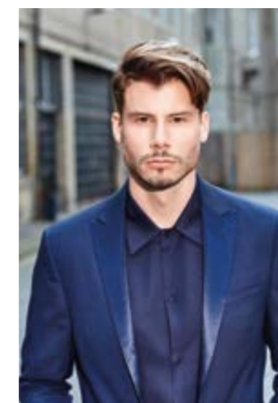
Motiv 7 | Art.-Nr. 1421