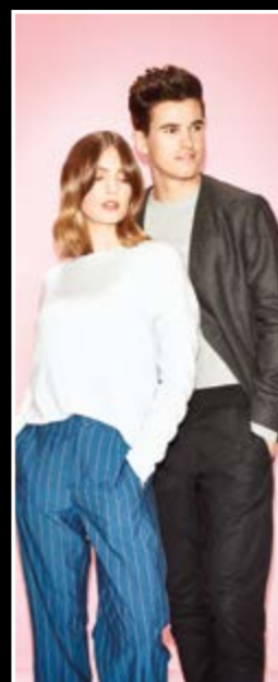
Banner-Motiv 3 Art.-Nr. 13701003

BITTE BEACHTEN SIE ..., dass der Bannerdruck von Umtausch und Rückgabe ausgeschlossen ist, da wir diese nur für Ihre Bestellung produzieren.