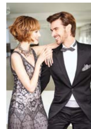
Motiv 6 | Art.-Nr. 1420