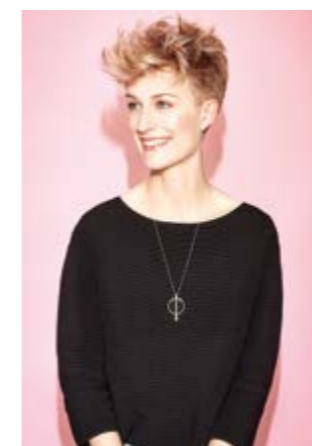
Motiv 2 | Art.-Nr. 1416