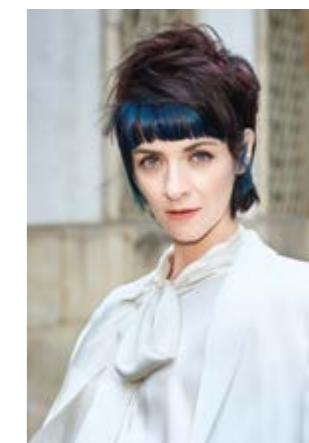
Motiv 8 | Art.-Nr. 1422