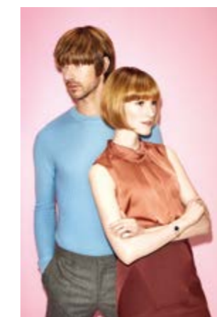
Motiv 3 | Art.-Nr. 1417