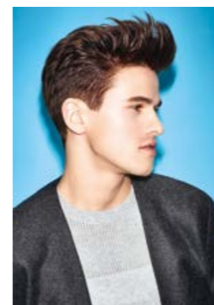
Motiv 1 | Art.-Nr. 1415

Die Trendlooks der H|MAG Trendkollektion bieten wir Ihnen auch als Poster und Banner an. Zeigen Sie ihren Kunden werbewirksam die Trends von morgen im Großformat!