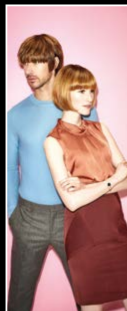
Banner-Motiv 2 Art.-Nr. 13701002