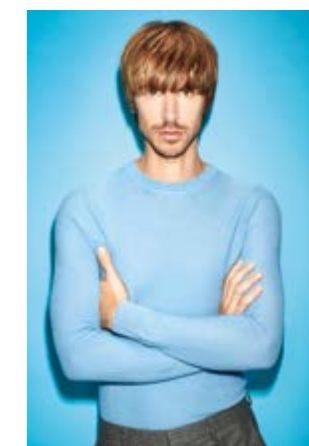
Motiv 4 | Art.-Nr. 1418